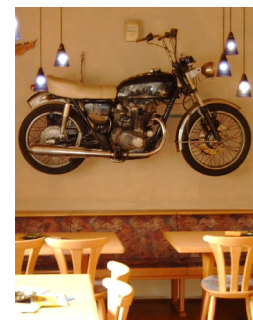
Motorrad im Rock-Café Sedan

Also, wenn du gerade in Weiden bist und nichts Besseres zu tun hast: Ein Besuch im Rock-Café Sedan lohnt sich immer!