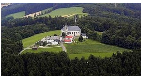
Wallfahrtskirche auf dem Fahrenberg

Schon sehr lange bezeichnet man ihn als den „heiligen Berg der Oberpfalz“, da sich dort eine der ältesten Marienwallfahrtsstätten unserer bayerischen Heimat befindet. Anfangs stand auf dem Fahrenberg eine Burg, die dann um 1200 an den Templerorden übergang. Seitdem wallfahrten Pilger dorthin.