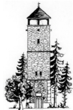
Vierlingsturm am Fischerberg

Am Gipfel kratzt der Vierlingsturm mit 25 Metern fast den Himmel. Der Turm, der jeden Mittwoch, Samstag und Sonntag geöffnet ist, bietet dir als höchster Punkt der Stadt Weiden eine tolle Aussicht. Für deine Verpflegung ist dann in der Strobelhütte bestens gesorgt.