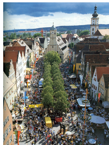
Bürgerfest am Stadtplatz