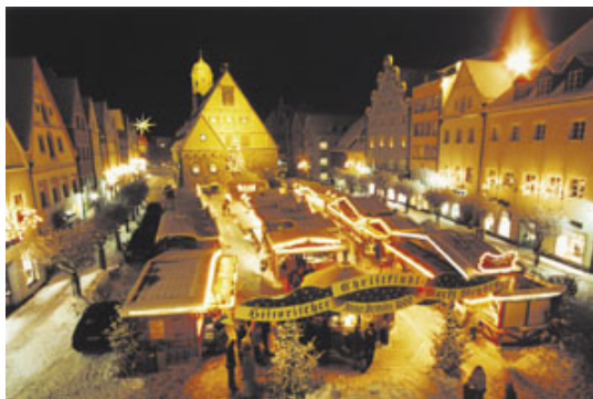
Weihnachtsmarkt am Weidener Stadtplatz

Er ist jedes Jahr das Weihnachts-Event des Jahres - der Adventskalender am Alten Rathaus . Riesengroß und mit 24 wunderschönen Fensterbildern geschmückt ist er immer wieder ein Glanzpunkt in der Adventszeit. Natürlich braucht das Alte Rathaus auch ein Christkind, das die