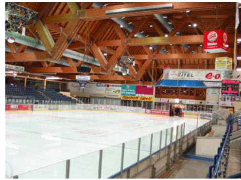
Blick auf die Eisbahn