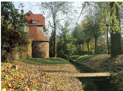
Stadtmauer im Max-Reger-Park

Der Flurerturm ist der letzte noch erhaltene Rest der alten Vorstadtmauer, die als äußere Stadtmauer im Jahre 1575 die bis dahin erfolgten Stadterweiterungen als Mauerring einschloss. Einst hatte diese äußere Stadtmauer vier Tortürme und zwei Rundtürme (den Rossturm und den Flurerturm). Der Baumeister der Vorstadtmauer war Meister Reicholt.