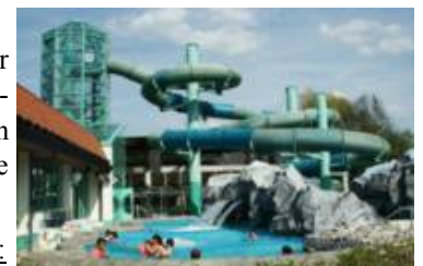
Großwasserrutsche in der Weidener Thermenwelt

Weidener Thermenwelt: Freizeitzentrum Weiden Raiffeisenstraße 7